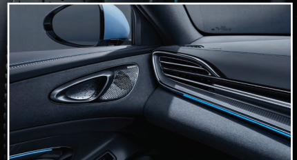
Dynaudio 12 Speakers