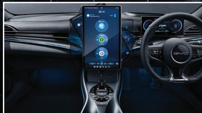
15.6" Rotatable Touch Screen