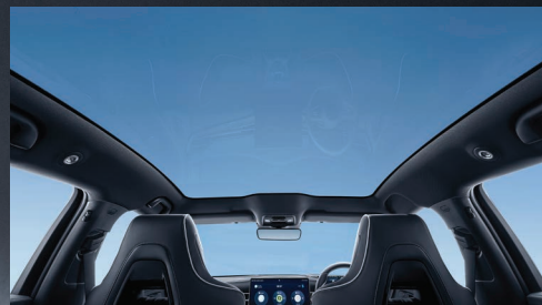
Silver-Plated Panoramic Glass Roof

ดีไซน์ภายใต้คอนเซ็ปต์ศิลปะแห่งท้องทะเล ตามแบบฉบับที่เป็นเอกลักษณ์ของ BYD OCEAN SERIES กับเส้นสายที่โฉบเฉี่ยวกว่าที่เคย ด้วยด้านหน้ารถแบบ X FACE ที่ผสานความเป็นสปอร์ตและความเรียบหรูเข้าด้วยกันอย่างลงตัว